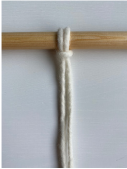
Kuva 1, Leivonpääsolmu