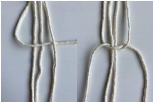
Kuva 2, KTS, 1. vaihe