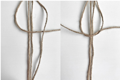
Kuva 1, KTS, 1. vaihe

LANKA- JA OHJETIEDUSTELUT: Lappajärven Värjäämö Oy, 040-838 5449, filona.fi.