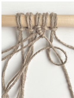
Kuva 4, Kohosolmu vasemmalle alaviistoon