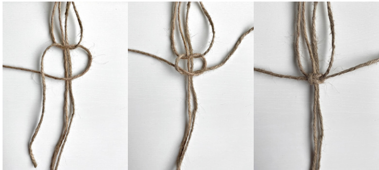
Kuva 2, KTS, 2. vaihe