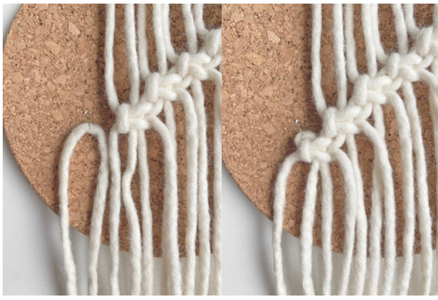
Kuva 6, langan lisäys = LL vasemmalle puolelle