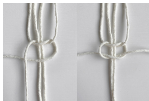
Kuva 3, KTS, 2. vaihe