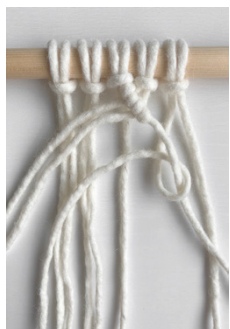
Kuva 4, KS oikealle alaviistoon