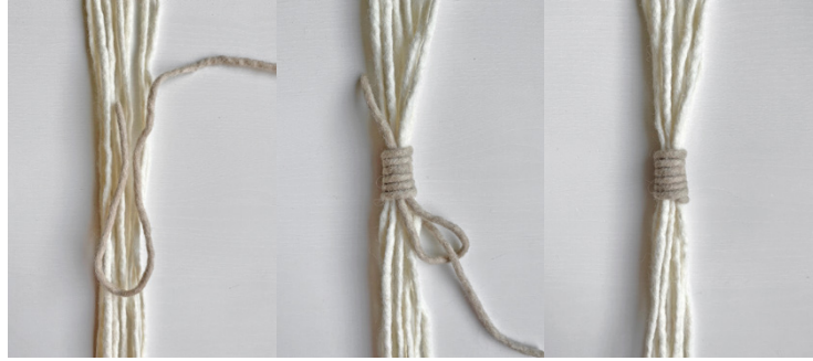
Kuva 9, Kääresolmu