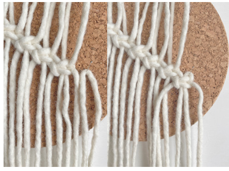
Kuva 7, langan lisäys = LL oikealle puolelle