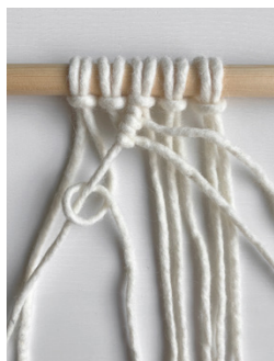
Kuva 5, KS vasemmalle alaviistoon