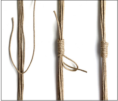
Kuva 4, Kääresolmu