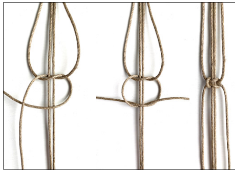
Kuva 2, KTS, 2. vaihe