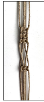
Kuva 3, KTS kiertäen