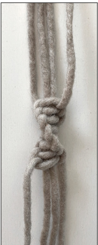
Kuva 4, TS