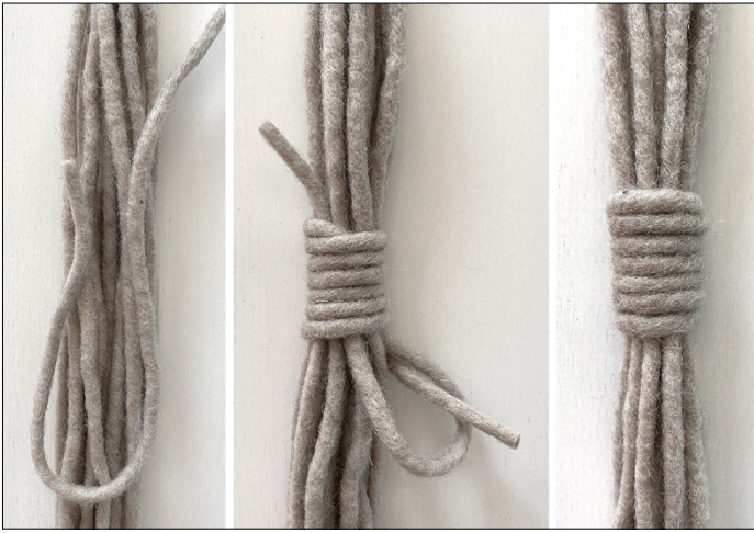
Kuva 1, Kääresolmu