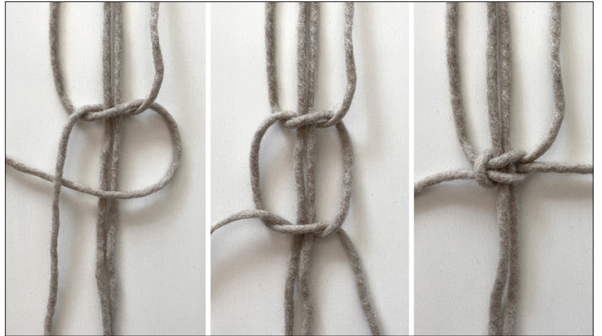
Kuva 3, KTS, 2. vaihe