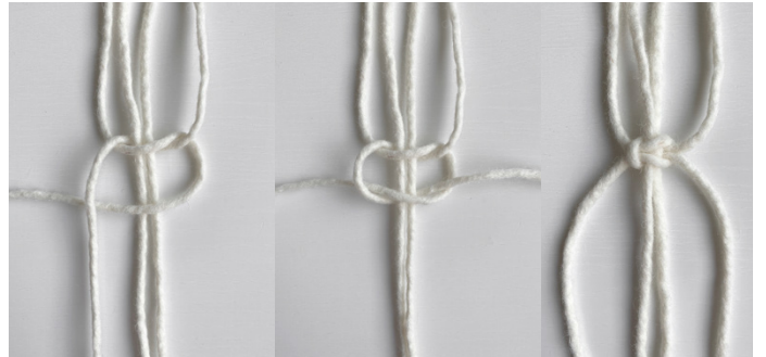
Kuva 3, KTS, 2. vaihe