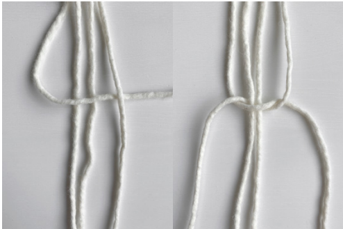
Kuva 2, KTS, 1. vaihe