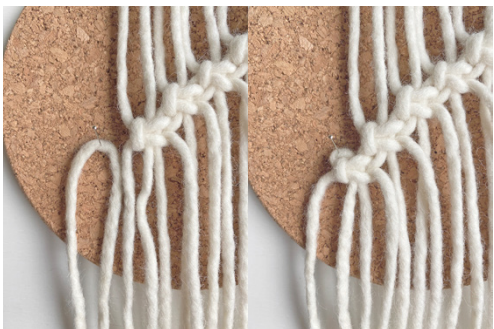
Kuva 6, langan lisäys = LL vasemmalle puolelle