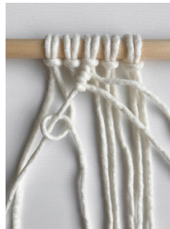
Kuva 5, KS vasemmalle alaviistoon