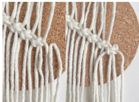
Kuva 7, langan lisäys = LL oikealle puolelle