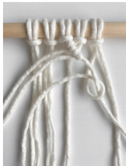
Kuva 4, KS oikealle alaviistoon