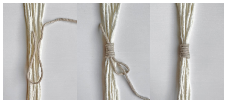
Kuva 9, Kääresolmu