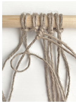
Kuva 6, Kohosolmu oikealle alaviistoon