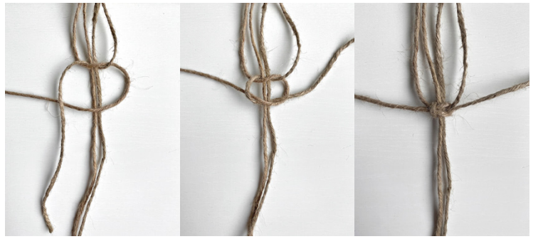
Kuva 2, KTS, 2. vaihe