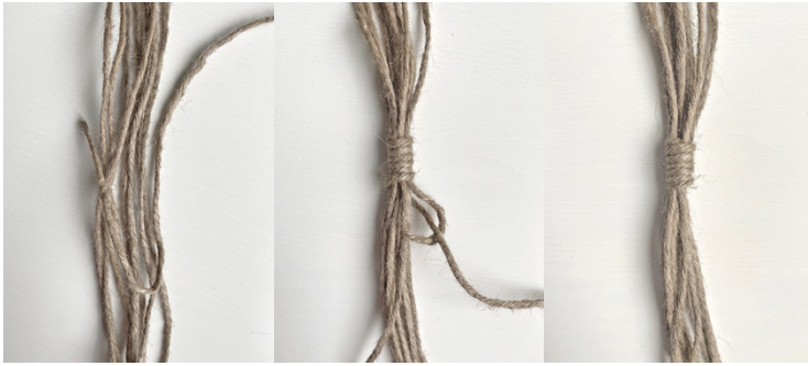
Kuva 3, Kääresolmu