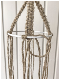
Kuva 5, KS