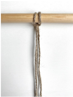
Kuva 4, Käänteinen leivonpääsolmu