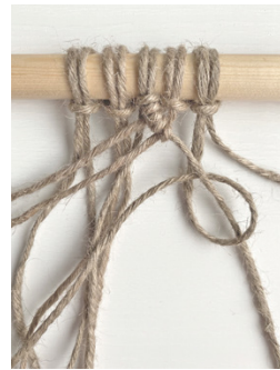
Kuva 7, Kohosolmu vasemmalle alaviistoon